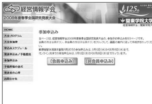
【エントリーページ】